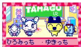
友だちと通信し、一緒に記念撮影ができる！