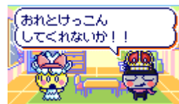
通信でプロポーズが可能に！