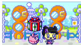
たまペットは庭で生活し、一緒にお出かけもできる！