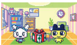
ダウンロードしたアイテムをプレゼントできる！

また、友だちと通信することで、友だちの育てているたまごっちキャラクター（以下、「たまとも」と自分の「たまとも」が一緒に「記念写真」が撮れたり、友だちの「たまとも」に「プロポーズ」することも可能になり、『Tamagotchi iD L』の通信遊びで、友だちとの新しいコミュニケーションをお楽しみいただけます。