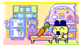
実ったアイテムは通信でプレゼントもできる！