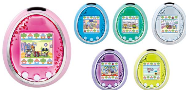
『Tamagotchi iD L』(全 6 色・各 5,040 円／税込)

主なターゲットは、7～9 歳の女兒で、主な販売ルートは全国の玩具店、百貨店・量販店の玩具売り場、インターネット通販などです。バンダイでは、小学生低学年女兒のデジタルコミュニケーションツール No.1 の『Tamagotchi iD L』を、2011 年 12 月末までに 80 万個販売する計画です。