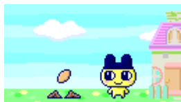
庭に種を植えるとアイテムが実る！

携帯電話からのダウンロードやゲーム内の「たまデパ」で購入した種を庭に植えるとアイテムが実り、家庭菜園気分を味わえます。実ったアイテムは食事として食べさせたり、通信で友だちにプレゼントすることもできます。