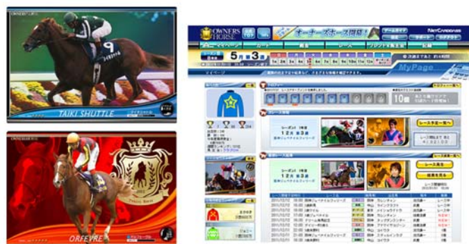
ネットカードダス「オーナーズホース」(カード3枚1セット:315円・税込)

なお、発売に先駆けて4月よりネットカードダス「オーナーズホース」のオープンβ版（パソコンのみ）を公開します。5月下旬のカード発売にあわせ、携帯電話・スマートフォンにも完全対応予定です。ゲーム内のレンタルカードを使用して無料でお楽しみいただけます。