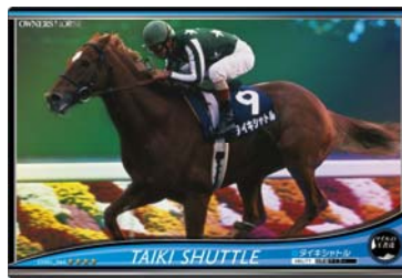
【マイルの王者】 タイキシャトル