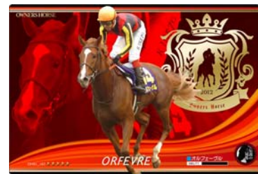
【伝説の三冠馬】 オルフェーヴル