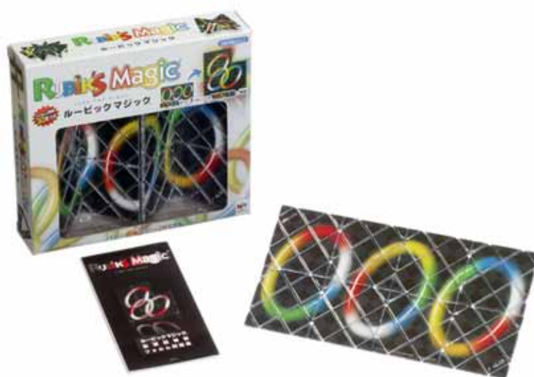
「ルービックマジック」

主なターゲットは10～30代男女で、販売ルートは全国の玩具店、百貨店・量販店の玩具売場です。メガハウスではこの「ルービックマジック」を2009年3月までに10万個の販売を計画しています。