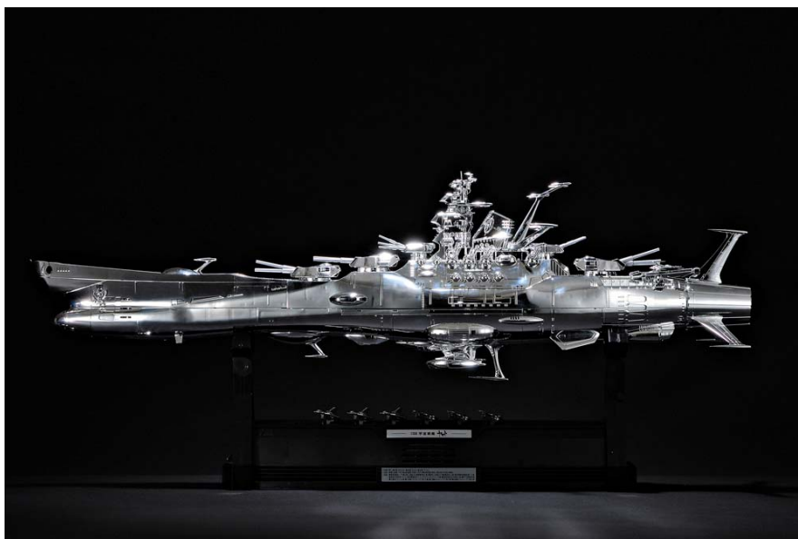
「1/350 宇宙戦艦ヤマト 空間磁力メッキVer.」 ©東北新社

※劇場版「宇宙戦艦ヤマト 復活篇」…2009年12月12日（土）より全国東宝系にて公開。