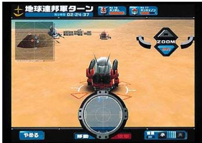
写真:バンダイネットワークス提供「ガンダム バトル シューティング」 (C)創通エージェンシー・サンライズ