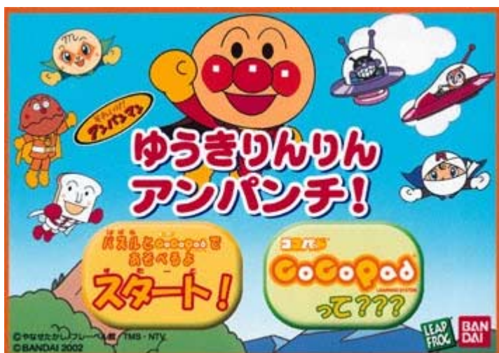
写真:バンダイ提供「ココパッド ゆうきりんりんアンパンチ」 (C)やなせたかし/フレーベル館・TMS・NTV